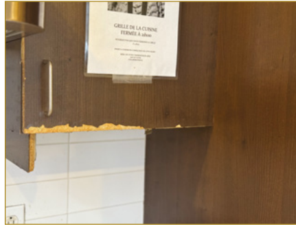
Cuisine avant et après

L'AVIRON SE REFAIT UNE BEAUTÉ ! Nous avons à cœur le bien-être de nos usagers et nous voulons leur permettre de vivre dans un environnement agréable et chaleureux. C'est pourquoi cette année nous avons :