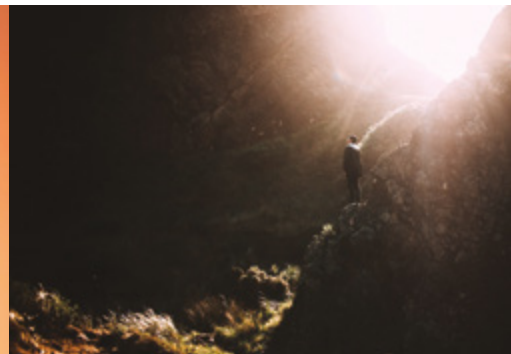
Hillie Chan . unsplash.com

Photo en 1 ère & 4 e de couverture . table des matières . pages 11 . 28 : Youssef Naddam . unsplash.com